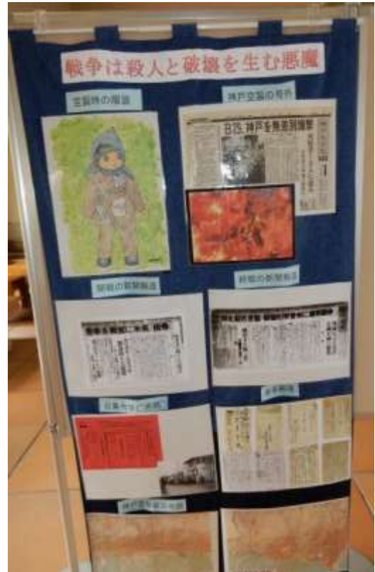
高校生の平和学習のまとめ