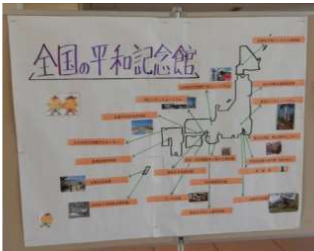
今回の展示が常設できるように 神戸にも平和記念館を設ける活動が 紹介されていました。