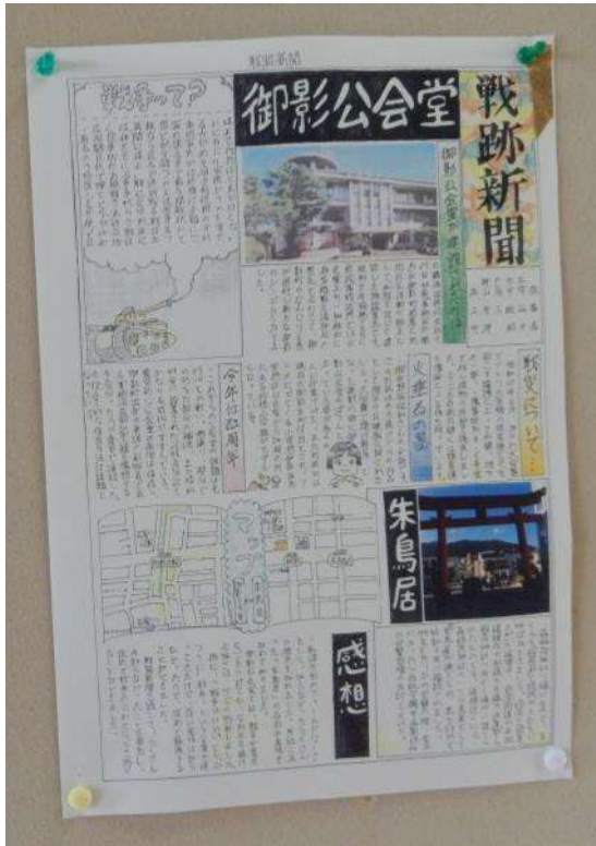
中学生が作成した新聞