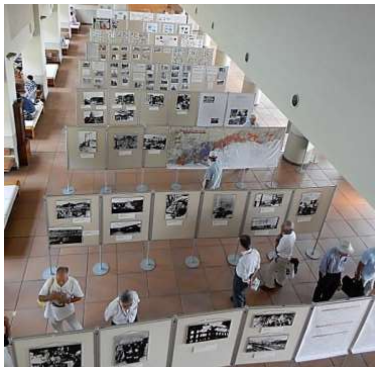
シルバーカレッジのふれあいホールを 使用して展示されました。