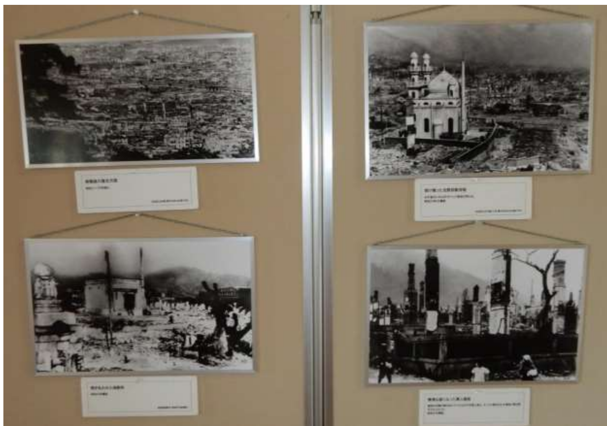
B29 爆撃機の焼夷弾により、焼け野原になった神戸市街地の写真