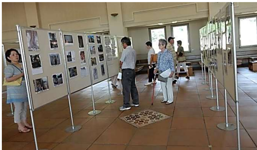
写真、マップなどを熱心に見ていました。